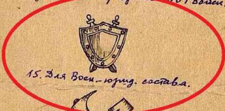
15. Для Воен.-юнг. состава.